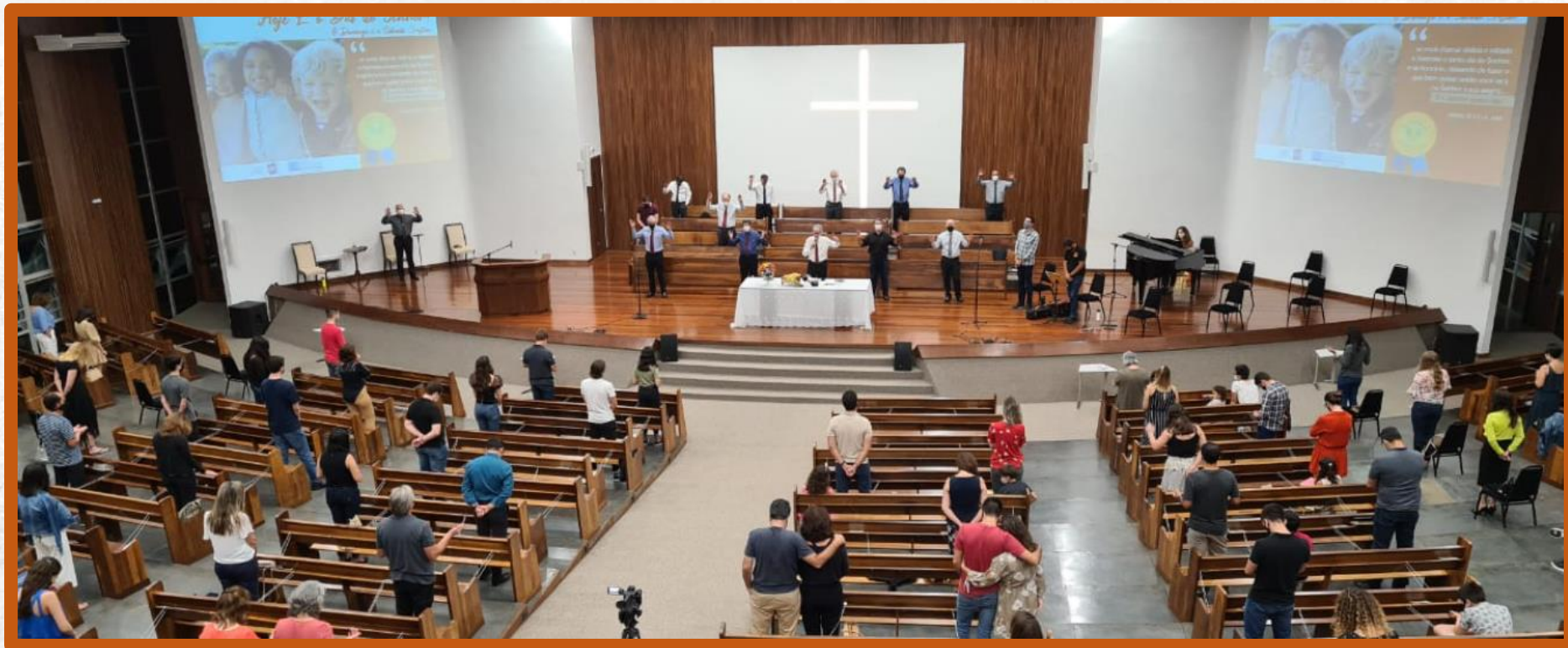
Foto do Culto de 13 Set 2020