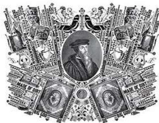
Illustration by Lorenzo Petrantoni for TIME

Calvinism is back, and not just musically. John Calvin's 16th