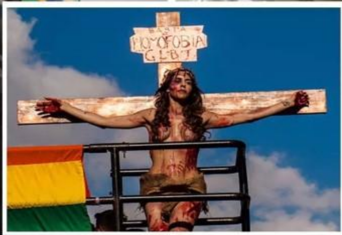
Transexual “crucificada” desfila de militar em parada gay de São Paulo!