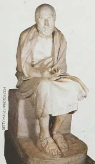
Estátua de Heródoto

Heródoto viajou para o Egito, para a Líbia, a Fenícia, a Babilônia, a Pérsia, a Macedônia, a Trácia e a Cítia. Em suas viagens tinha a preocupação de estudar as origens dos povos que visitava, de fazer estudos sobre o território que ocupavam e de registrar os eventos que testemunhava. Quando esteve no Egito, por exemplo, descreveu o território ocupado pelos egípcios, os monumentos que haviam construído, o comportamento e a religião deles. E também deixou relatos sobre guerras, como a guerra entre persas e gregos, sobre a qual escreveu após investigar detalhadamente esses povos.